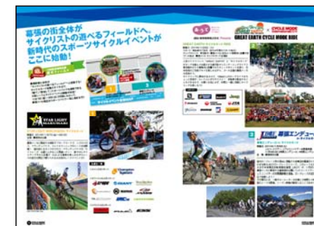
※2014年公式ガイドブック