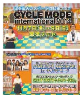
■テレビ東京 特集番組

放送時期:2014年8月30日～11月7日 内容：CM15秒告知 420本 主な番組：ワールドビジネスサテライト、NEWSアンサー、7スタLIVE!など