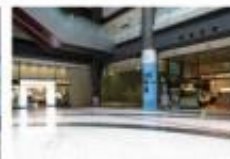
view 正面[A/B]右手【TULLY'S COFFEE】 の奥に奥に、タワーCオフィスエント ランスがあります。タワーCオフィスエ ントランスにお進みください。