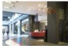
エスカレーターを降りると、1Fインフォメーション 場に出ます。