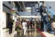
view 北館に入ると正面に誘導サインが 掲示されています。【カンファレンス ルーム タワーC】 を目標してお進みください。