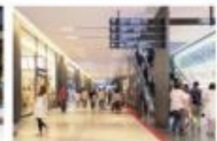
view 北館に入ると正面に誘導サインが 掲示されています。【カンファレンス ルーム タワーC】の誘導に従って、 北館中央のナレッジプラザにお進 みください。