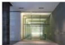
view タワーCオフィスエントランスホールの突き当たり右手に進むと、エレベーターホール 入口があります。