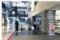
view 右手タワーBオフィスエントランス を越えてすぐの降りエスカレー ターに乗り1Fに降ります。