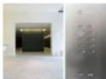
view 8階に上がります。(A・Bどちらの エレベーターでも使えます。)