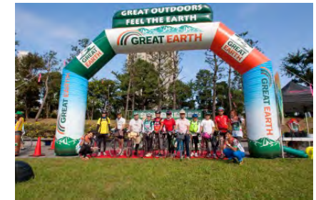
ゴールゲートイメージ