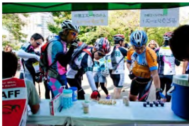
チェックポイントイメージ