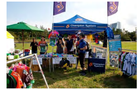
協賛スポンサー P Rスペースイメージ